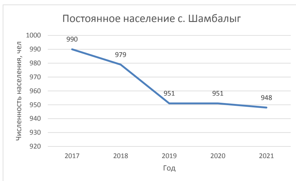
Рисунок 1 – Динамика численности постоянного населения за период 2017–2021 гг. (на начало года), человек

Численность постоянного населения сельского поселения сумона Шамбалыг на начало 2021 года составляет 948 человек. Динамика численности постоянного населения муниципального образования за период 2017–2021 гг. представлена ниже на диаграмме (Рисунок 1).